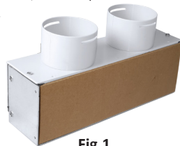
Fig.1 Adattatore con tappo in cartone