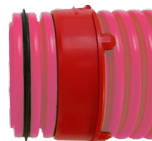
Soluzione 1 Fig. 4

Per ulteriori chiarimenti sul taglio, sul fissaggio dei tubi sui collarini GREY e sulla posa di articoli aventi collarini GREY vedi anche il foglio di istruzioni a parte.