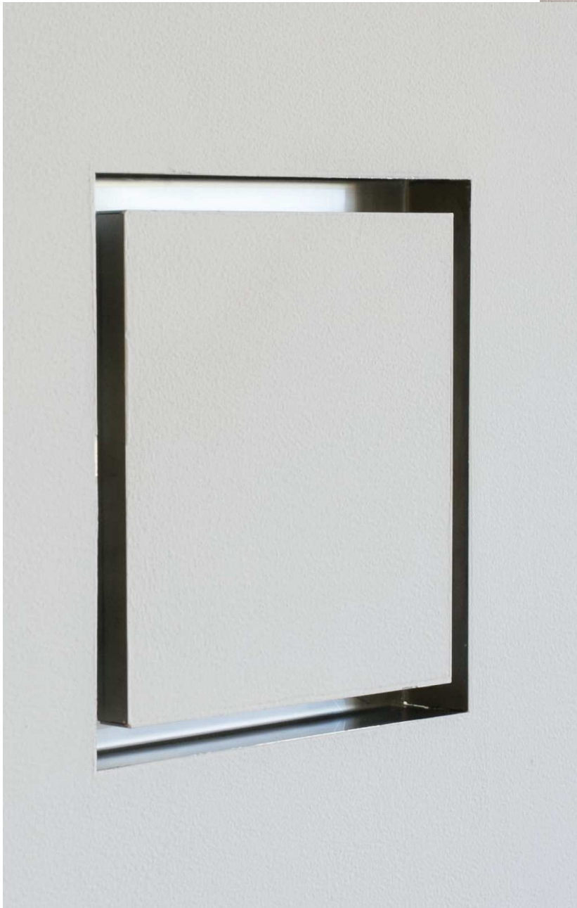
Schermo quadrato filomuro personalizzabile tono su tono