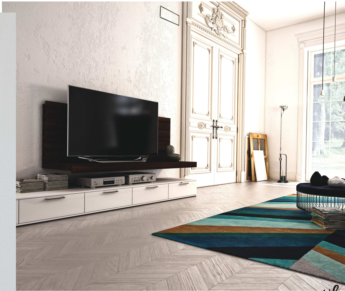
Schermo rettangolare filomuro personalizzato con intonaco grezzo