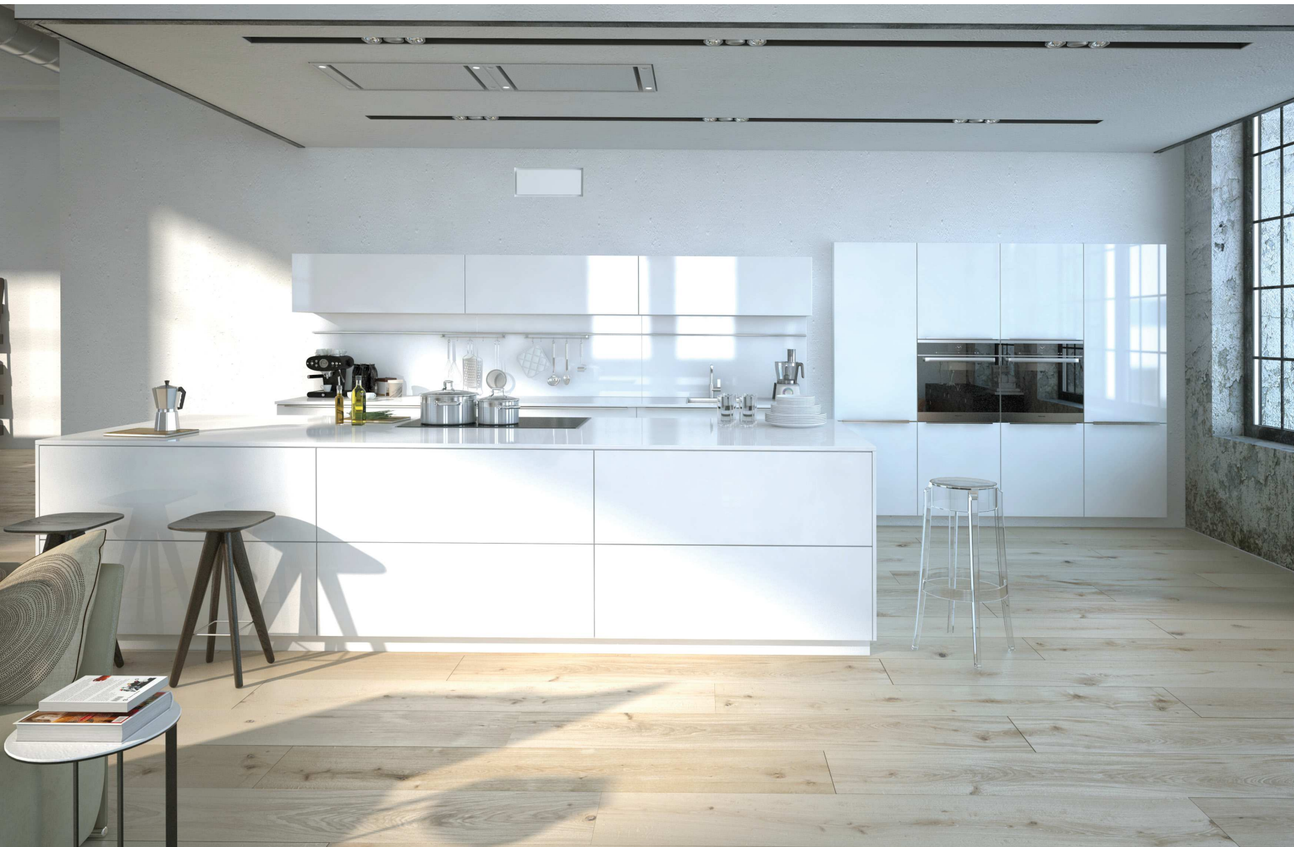
Schermo rettangolare filomuro tono su tono