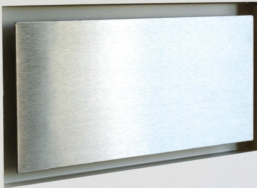
Schermo rettangolare filomuro inox spazzolato