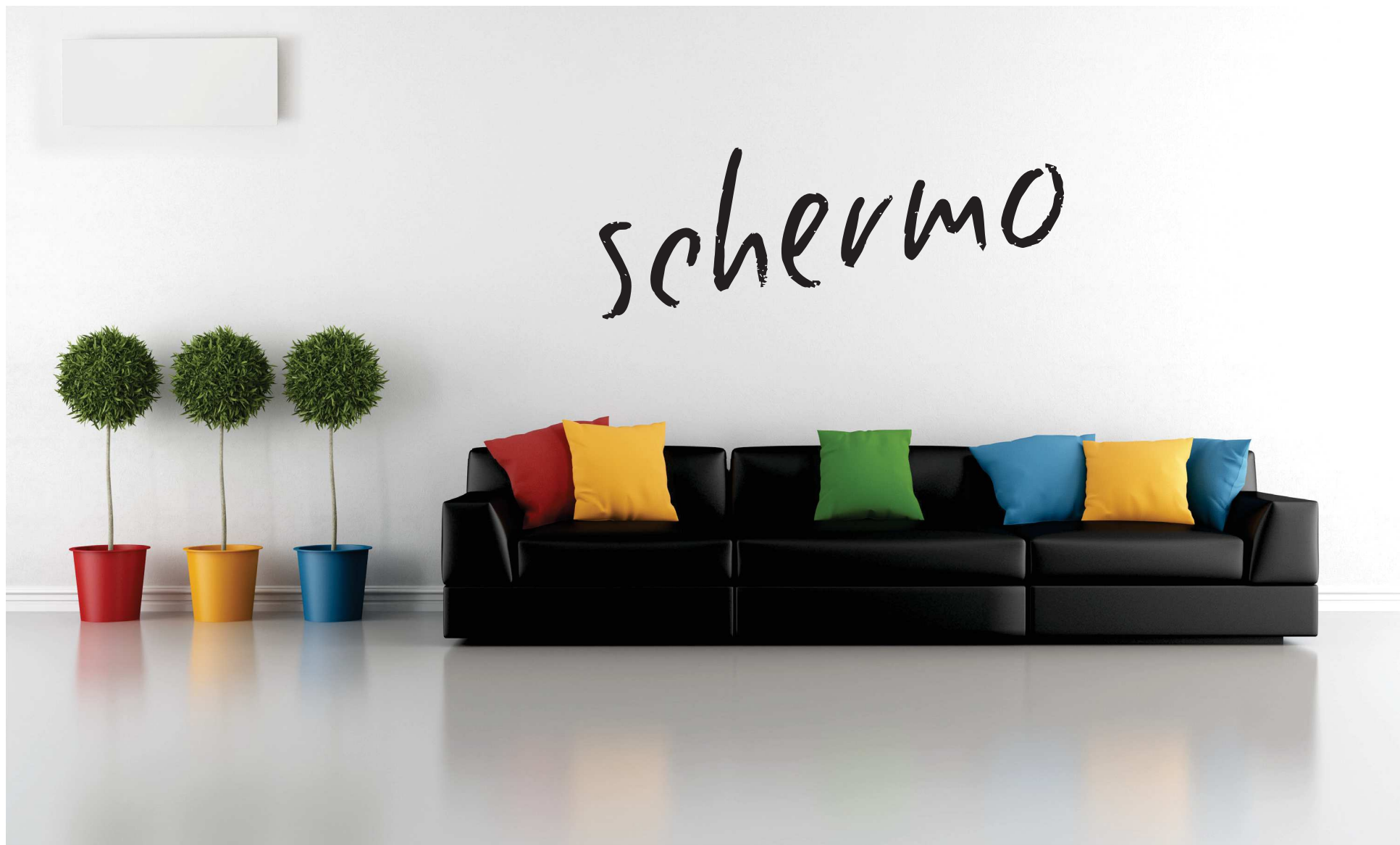
Schermo rettangolare in tinta parete