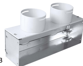
Fig.3 Adattatore in lamiera zincata - PVC (acquistabile a parte)

Il diffusore FLAT a schermo piatto normale è composto dallo schermo e dalla cornice.