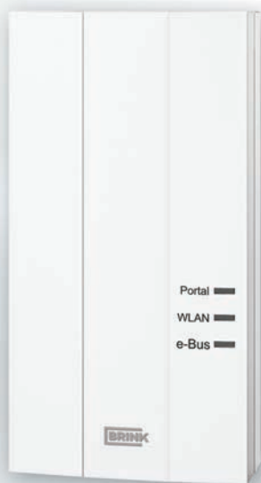
Brink Home Module

Brink Home è composto da Modulo Brink Home e Brink Home App, i quali vengono collegati al Renovent e alla sua unità di controllo Air Control. Gli apparecchi Brink della serie Renovent sono quindi accessibili attraverso un router (W) LAN o al Brink Portal Server. Inoltre il modulo Brink Home supporta i moduli di controllo SM1 SM2. Brink Home App per smartphone e tablet è disponibile per i sistemi Android e iOS.