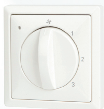
Interruttore a 4 vie con indicazione dei filtri

Il commutatore a 4 vie ha un piccolo LED per indicare lo stato dei filtri. Quando questo si illumina, i filtri devono essere puliti.