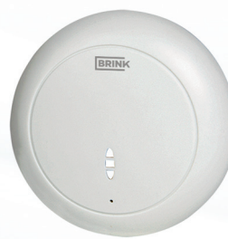
Sensore di CO 2

Con un sensore di CO 2 si può regolare la portata di ventilazione in base alla presenza di CO 2 .