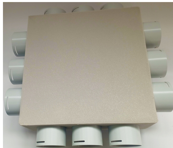
Lato inferiore del box