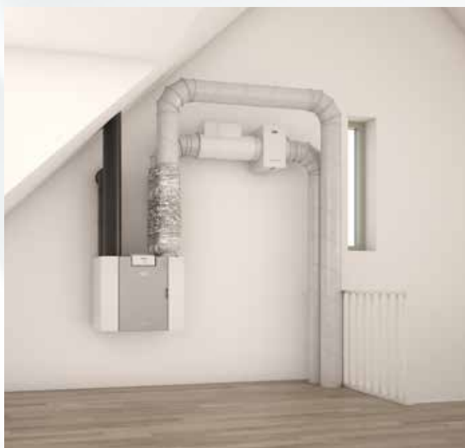
Pure induct va montato subito dopo l'apparecchio VMC, nel tratto d'immissione aria.